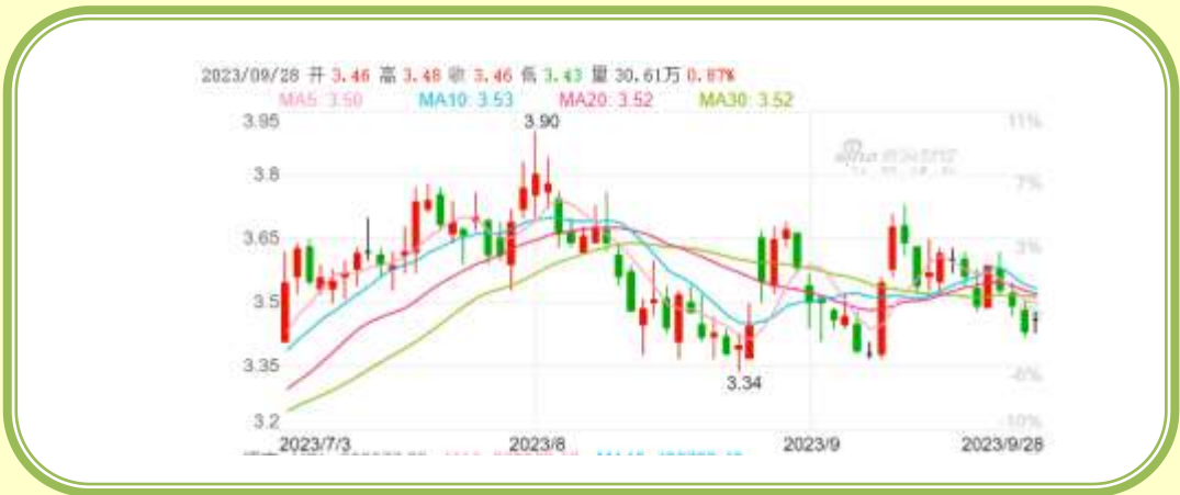
(福田汽车 K 线图，截至 9 月 30 日)