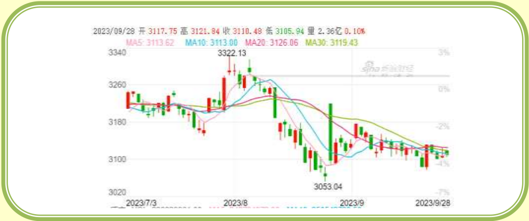
(上证指数 K 线图，截至 9 月 30 日)