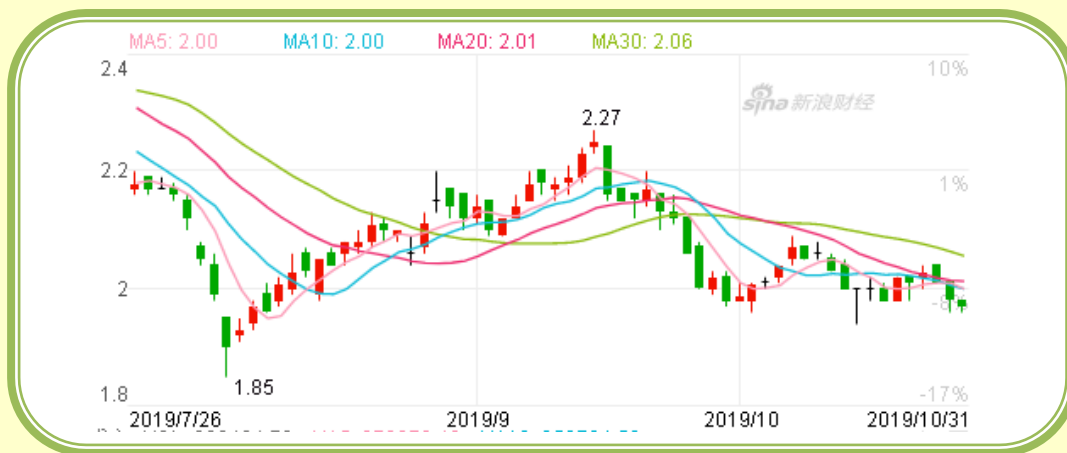
(福田汽车股价走势图，截至 10 月 31 日)