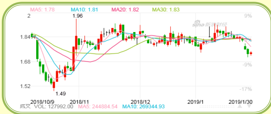
(福田汽车股价走势图, 截至 1 月 30 日)