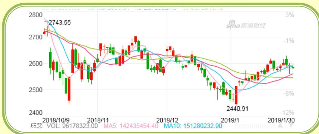
(上证指数 K 线图, 截至 1 月 30 日)